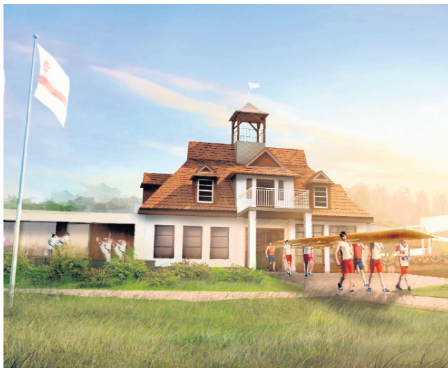
► Po planowanej rozbudowie przystani Polonii przy ul. Wioślarskiej 74 będzie prezentowała się bardzo efektownie

Przyszła inwestycja wpisuje się w program partnersko-publiczny kompleksowego planu rozwoju terenów nadwarciańskich miasta Poznania „Na Rzecz Warty”, który ma na celu przywrócenie przyrodniczego i rekreacyjnego potencjału tych terenów mieszkańcom i turystom. - Widzimy niewykorzystany potencjał nadwarciańskiego bulwaru. Przez rewitali-