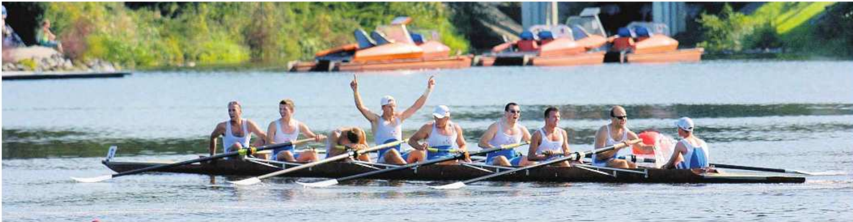
Zwycięska osada Klubu Wioślarskiego z 1904 roku za metą dorocznego Wyścigu Ósemek o Puchar Prezydenta Poznania

Wyścig Ósemek o Puchar Prezydenta i mistrzostwa miasta Poznania